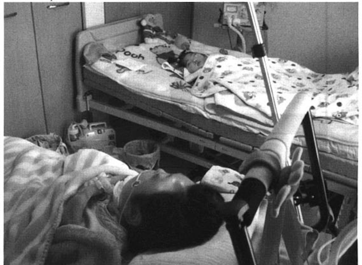
たける君（手前）と女兒でこの部屋はもう一杯です （研究事業のときの6畳和室）

2008年6月から重症障がい児者レスパイトケア施設うりずんをオープン（定員3名）した。「うり